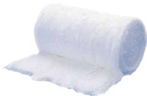
ROLLO DE ALGODÓN 0a001