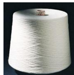
HILO DE ALGODÓN 0H001